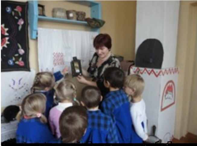
Где дети знакомятся с традиционными предметами быта

22.04.2016 07:16 - Обновлено 01.02.2020 06:58