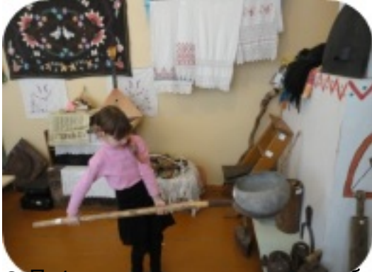
Видеопрезентация о традиционных предметах быта, сделанная детьми в рамках проекта «Традиции»