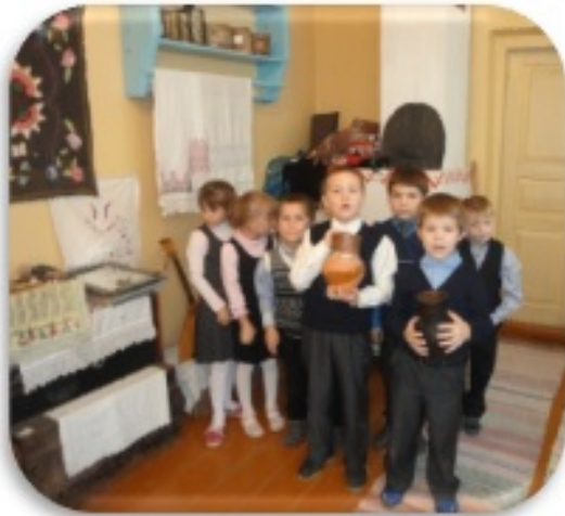
Видеопрезентация о традиционных предметах быта, сделанная детьми в рамках проекта «Традиции»