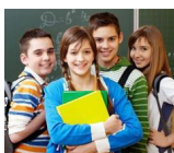
Виртуальный кабинет профориентации

Мир профессий огромен и многолик! Третью своей жизни человек проводит на работе. И прекрасно, если она в радость.